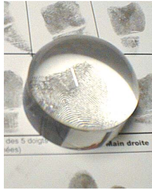
LOUPE A PLAT