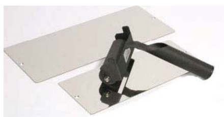
FPT258 - FPT260