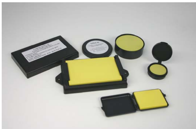
GAMME DES TAMPONS SANS ENCRE