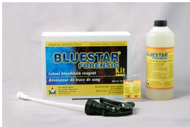
KIT BLUE STAR