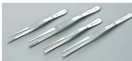
EPPDSG11 / EPPDSG18