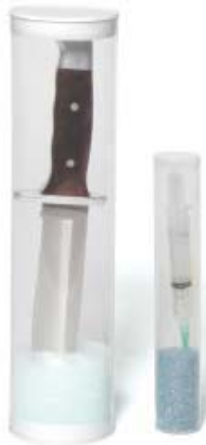
ECT3 / ECT1