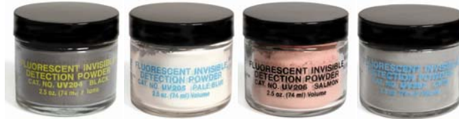
POUDRES DE DETECTION INVISIBLE