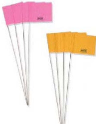
EVFP100 / EVFO100