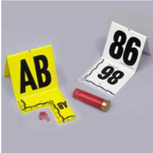
COUPES / STANDARDS