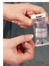
3-Brisez les ampoules et secouez.