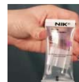
4-Observez la réaction et jugez.