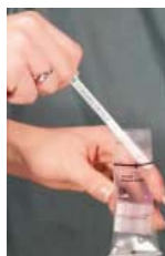
2-Insérez l'échantillon à l'aide du bâtonnet.