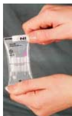
1-Ouvrez la pochette en faisant glisser la barrette.